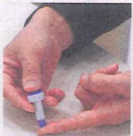
専用器具で、針で刺す程度の小さな傷を指に付けます

「健康チェック」を週1回実施しています。調べられるのはHbA1c(ヘモグロビンエーワンシー)、中性脂肪、HDLコレステロール。これらの数値は、糖尿病など生活習慣病の早期発見につながるのだとか。